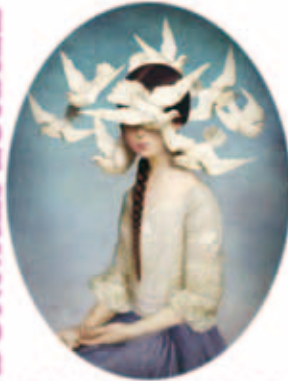
Iniziativa ed incontri realizzati dalle Donne per le Donne