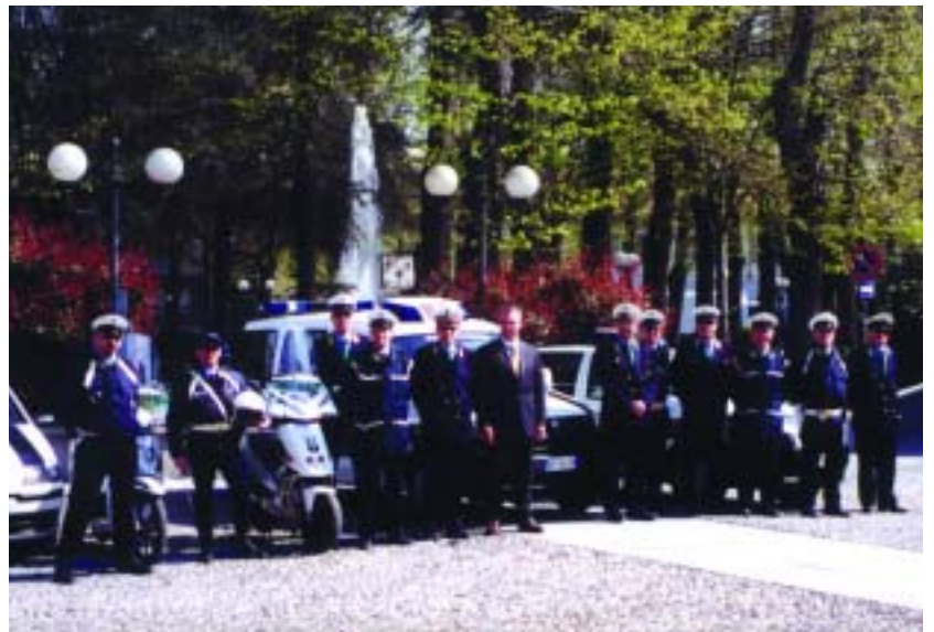
La Polizia Municipale di Codogno

La nuova compagine sarà composta prossimamente da 17 unità, la sede sarà il Comando di Codogno, che provvederà, oltre a garantire il servizio in turnazione su tutto il territorio intercomunale anche a gestire tutti gli aspetti burocratici ed amministrativi legati al servizio.