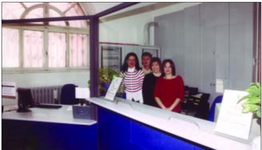
Gli operatori dell'Ufficio Relazioni per il pubblico (URP)

I risultati dell'iniziativa ed il contenuto delle vostre segnalazioni/suggerimenti saranno pubblicati sul prossimo numero di Codogno Notizie. Se il riscontro all'iniziativa sarà positivo, saremo felici di riproporre altre giornate nei mesi di settembre ed ottobre.