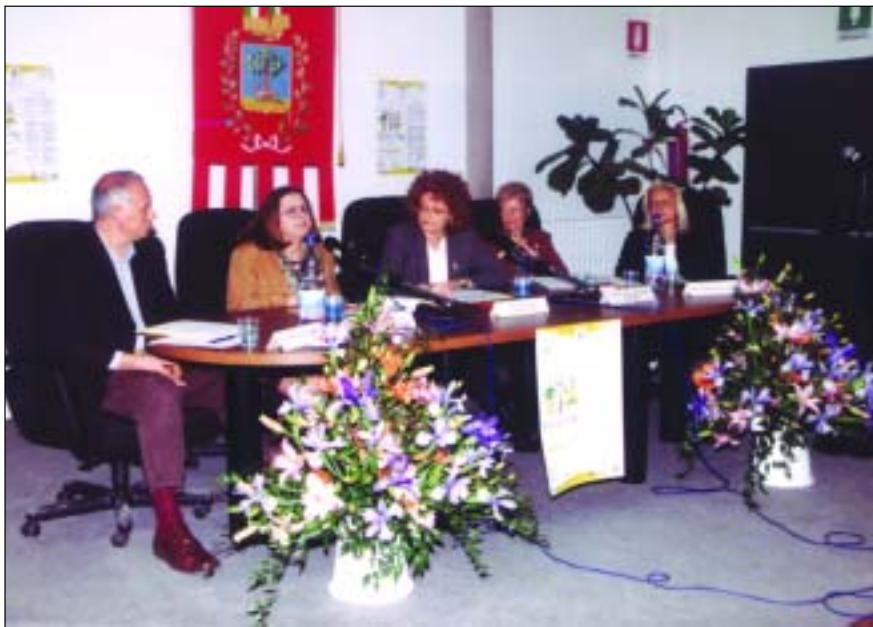
Il tavolo dei relatori del Convegno

Dall'elaborazione dei questionari restituiti, esattamente 155, è emerso che l'iniziativa è stata molto apprezzata dal pubblico, poiché ben organizzata nella sua interezza. Numerosi sono stati gli inviti a continuare anche nei prossimi anni, sempre meglio!