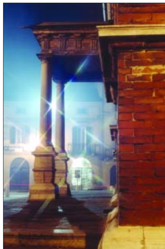
Aldo Faccendini - Segnalato dalla Commissione concorso "La Città in posa" - Cat. "Chiese e Monumenti" - Sez. Adulti - Pro tiro

Martedì 10.15-12.15 / 14.15-18.30 Mercoledì 10.15-12.15 / 14.15-17.30 Giovedì 10.15-12.15 / 14.15-18.30 Venerdì 10.15-12.15 / 14.15-17.30 Sabato 9.30-13.00